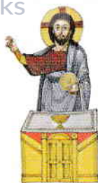
12. Încheiere și continuarea călătoriei