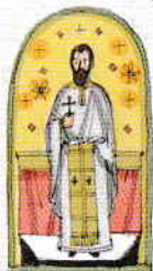
2. Indicarea destinației („Binecuvântată este Împărăția Tatălui și a Fiului și a făntului Duh”)