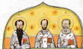
4. Verificarea direcției de mers prin folosirea busolelor (Predica insuflată din Părinții și Sfinții Bisericii)