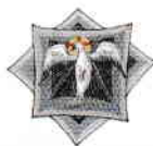
9. Chemarea Duhului Sfânt (Epicleza și sfințirea Darurilor)