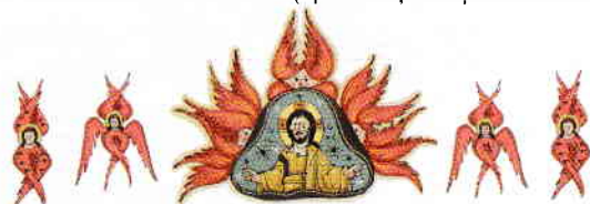
8. Zbor în cer (cântăm împreună cu Îngerii și Sfinții: „Sfânt, Sfânt, Sfânt...”)